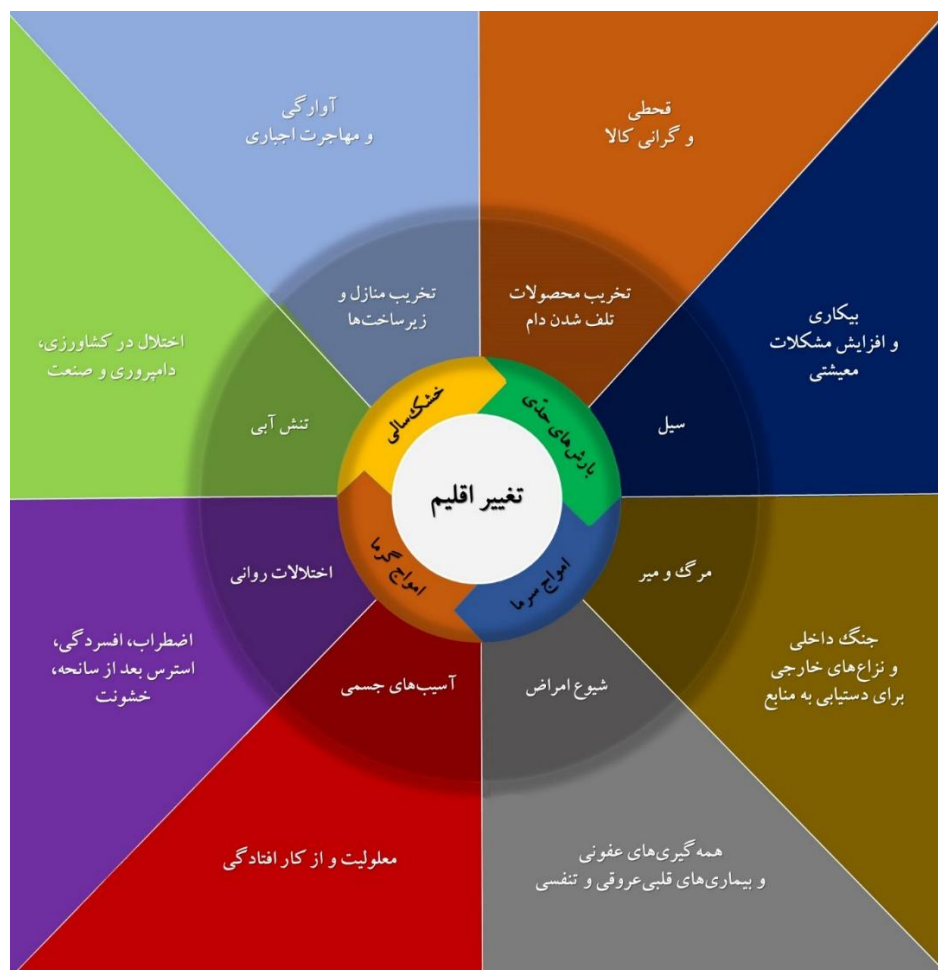
شکل ۲. پیامدهای افزایش رویدادهای آب‌وهوایی حدی مرتبط با تغییر اقلیم بر معیشت و سلامت انسان (نگارنده).